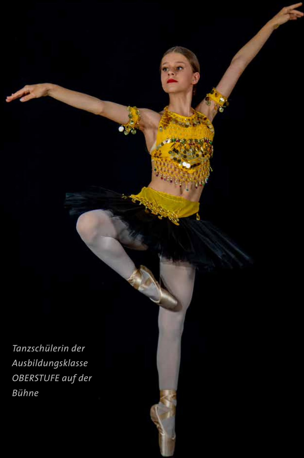
Tanzschülerin der Ausbildungsklasse OBERSTUFE auf der Bühne